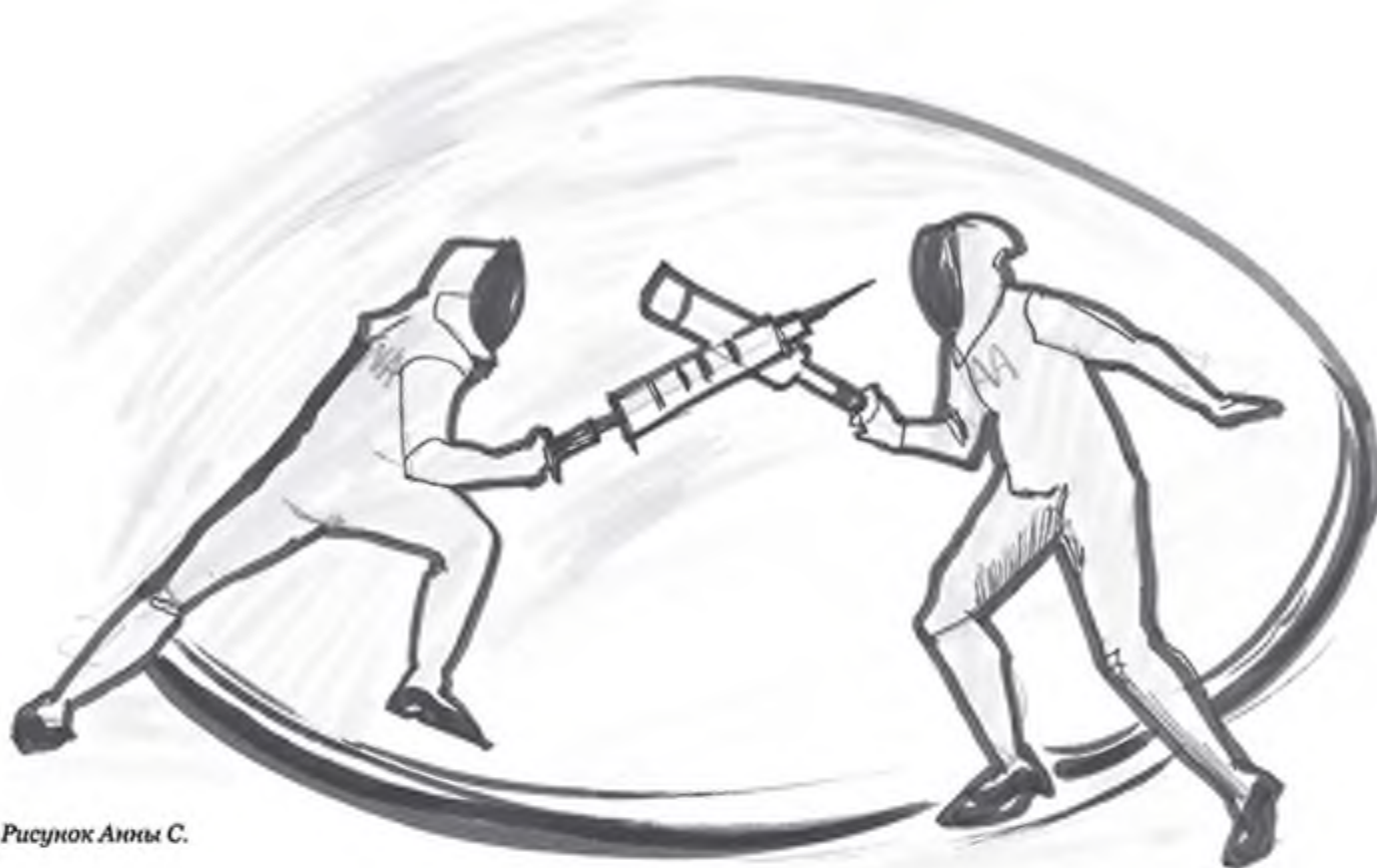
Рисунок Анны С.